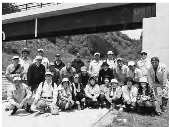
【ボランティアのみなさんお疲れ様でした】