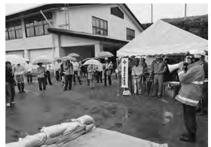
【小雨の中の終了式】