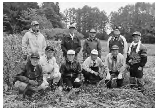
【遊休農地活性化委員会のみなさん】