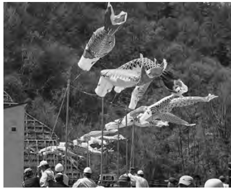
【浅川ダムサイトに泳ぐ鯉のぼり (H30. 5)】