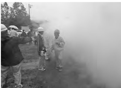
【煙の中を右往左往！？】