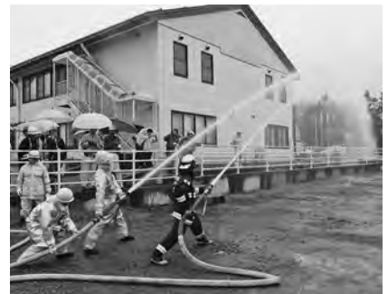
【新しく浅川分団に導入されたポンプ車～当日、消防団による放水披露が行われました】