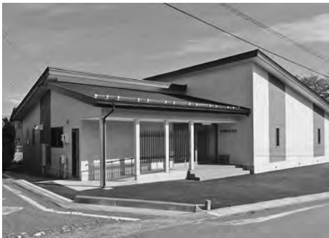
【新設された神楽橋区集会所】

神楽橋区では区民の念願だった集会所が竣工、10月8日集会所落成祝賀会が行われました。平成13年に神楽橋ニュープラン21委員会において集会所建て替えの必要性が提起されて以降、26年には建設構想委員会を設置。