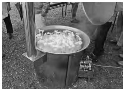
【炊出し訓練～ガスバーナーが壊れて大変でした】