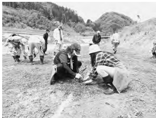
【みんなでフジバカマを植え付けました！】