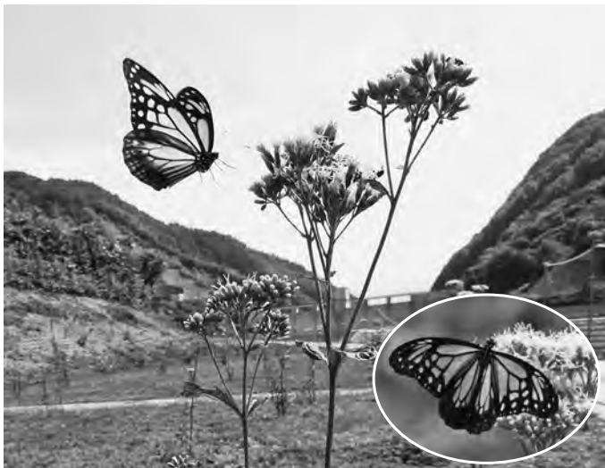
【華麗に舞うアサギマダラ～浅川ダム・フジバカマ苑（10月2日・3日撮影）】