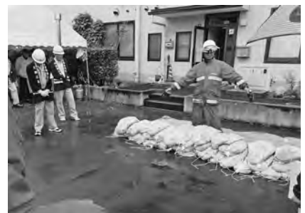
【想像以上に重かった！土のう積み】