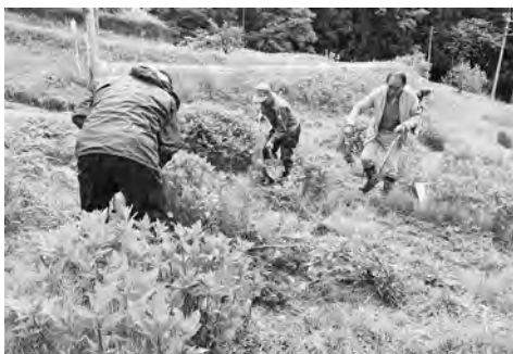
【七二会から苗を購入しました】

フジバカマを植え付けたダム天端は10月10日に開催された浅川ダム利活用懇談会で「浅川ダム・フジバカマ苑」と名付けられました。浅川地区を始めとして多くの長野市民が訪れ憩う場所になればと願っています。