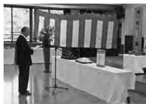
【竹元遺族会長“追悼のことば”】