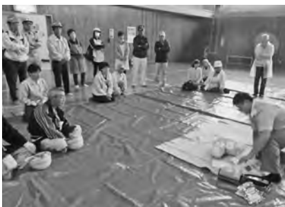
【救護の基本～AED操作訓練】