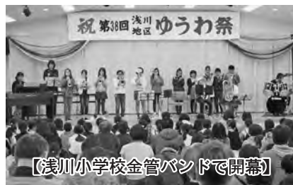
【浅川小学校金管バンドで開幕】

展示コーナーでは陶芸品、手芸品、写真、パッチワーク等、趣味の域を超えた力作が揃いました。公民館ロビーでは長野市市民窓口課の「マイナンバーカードの申請窓口」が設けられ“この際に申請を”という人たちが100人超が申請を行いました。