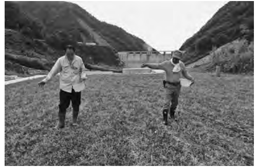
【草ぼうぼうの天端の草刈り、菜の花の種を播きました！】