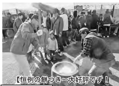
【恒例の餅つき～大好評です！】