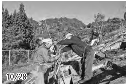
【花モモの植栽、力を合わせて植え付けました！】

浅川ダムでは今年初めて鯉のぼりを掲揚したり、浅川河川敷ではホタル観賞会を行ったりと活発な取り組みが始まっています。来年に向けてさらにブランド薬師遊歩道の整備などを進めていく計画です。区民のみなさんの一層のご理解とご協力をお願いします。