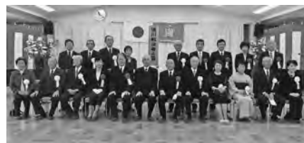
【遺族会、来賓のみなさん】