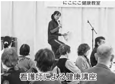
にこにこ健康教室