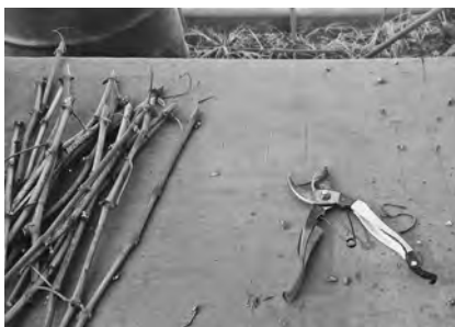
【挿し木を作っています】

今年5月連休明けの植樹を目指して準備を進めています。昨年末に栽培予定地（浅川ダム残土置場）へ搬入を開始したオガクズ（キノコ廃培地コーンコブ）は、雪のため一時中断、3月の天候次第で搬入を再開し、一定量に達した時点で、大型重機による開墾工事（土壌改良）を始める予定です。