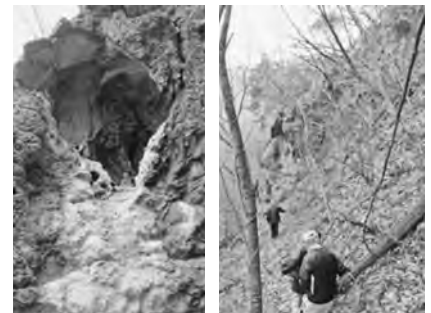
【秋場三尺坊及び参道】