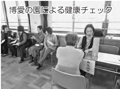
博愛の園による健康チェック