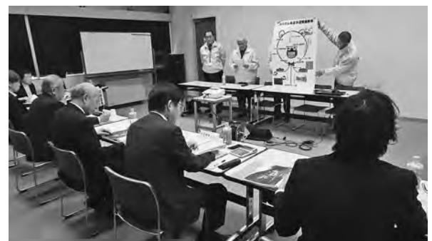
【審査委員会の様子】

浅川地区住民自治協議会では「まちづくり計画」4年目の推進事業としてブランド薬師参道十三仏の案内看板設置整備、秋場三尺坊へ至る参道補修整備、新たなウォーキングマップ作成等を内容とした「浅川ダム周遊歩道整備事業」について提案申請をした結果、予備審査を経て、3月6日の「長野まちづくり活動審査委員会」で31年度補助金事業として採択されました。審査委員会では12地区の住民自治協議会及び14団体からの提案が審査されました。