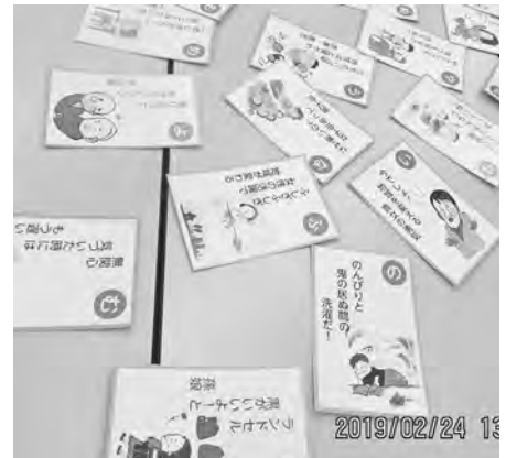
【男女共同参画カルタ】

2月24日（日）公民館冬期学級の第10講座として「浅川地区男女共同参画推進集会」が開催されました。例年「講演会」を主体に行ってききましたが、今年は人権啓発委員会の女性委員中心が企画し、「男女共同参画ってな・あ・に？～『カルタを使ってみんなで考えます』～認め合う みんな違って みんないい～」をテーマに参加者参加型の「講座」として開催しました。