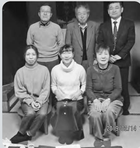
【広報委員のみなさん】

住民自治協議会の次世代育成部会 育成会長などというタイヤ組み換えを担う器でない私が何とか役割をやり終えることができたのも、関係した多くの方々の優しく温かいお力添えがあったからこそだと思っています。