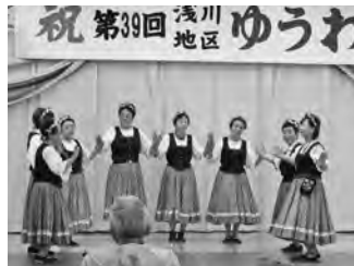
【みなさんの熱演に会場がわきました!】