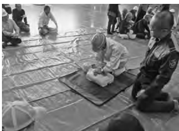
【心臓マッサージは大変です！】