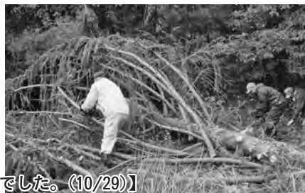
【雨の中、えごまを収穫。台風19号の倒木の片付けが大変でした。(10/29)】