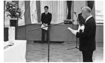
【竹元遺族会長“追悼のこぼ”】