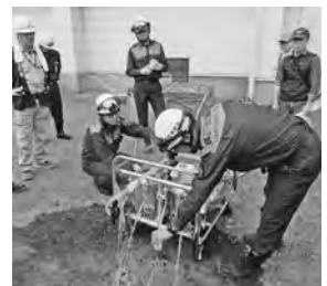
【見事に水がキレイに！】