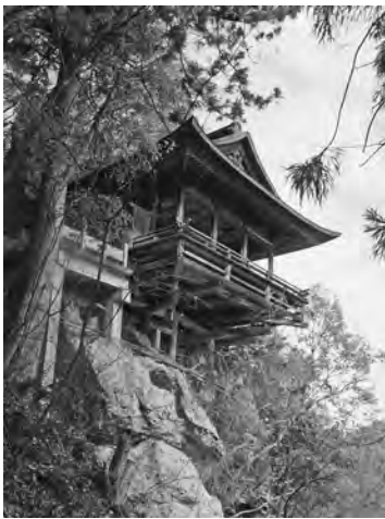
【秋のブランド薬師】

「浅川地区まちづくり計画」の今年度の主要事業であるブランド薬師参道に点在する十三仏と浅川ダム天端のフジバカマ苑、石油井戸跡の案内板設置が「チーム・フロンティア浅川」のメンバーや区民・ボランティアの協力によって完了しました。