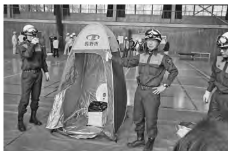
【簡易トイレと間仕切りの設営～避難所の生活を想いみな興味深々でした】