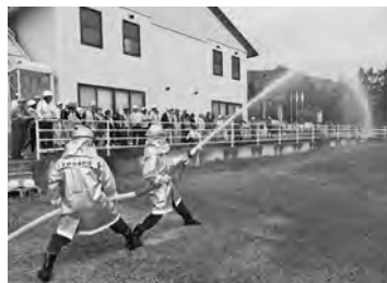
【消防団による放水披露】

最初に消防団浅川分団による放水の披露が行われ、それに続いて参加者が3班に分かれ（A）煙体験・消火器操作訓練（B）浄水器・投光器使用及び簡易トイレ・避難所間仕切り設営訓練（C）救急措置・AED操作訓練をローテーションで実施しました。救急救護班のみなさんによる炊出し訓練では、お米に麺つゆを混ぜた非常食が参加者に配られ美味しいと好評でした。