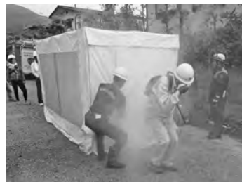
【煙体験～前は全く見えません！】