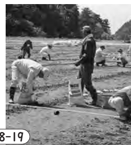
【いよいよ植樹、ボランティアのみなさんに感謝！】