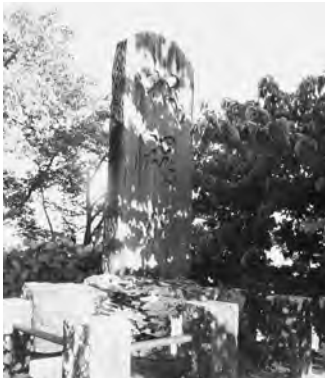
【戦没者招魂碑～93柱が眠る (公民館分室前庭)】

10月12日(土)戦没者御遺族、来賓、区民等60名余が参列し、浅川地区戦没者追悼式が行われました。式では列席者黙禱、君が代斉唱に続