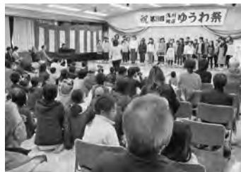
【浅川小学校合唱部の演奏で開幕】