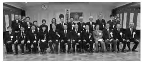
【遺族会、来賓のみなさん】