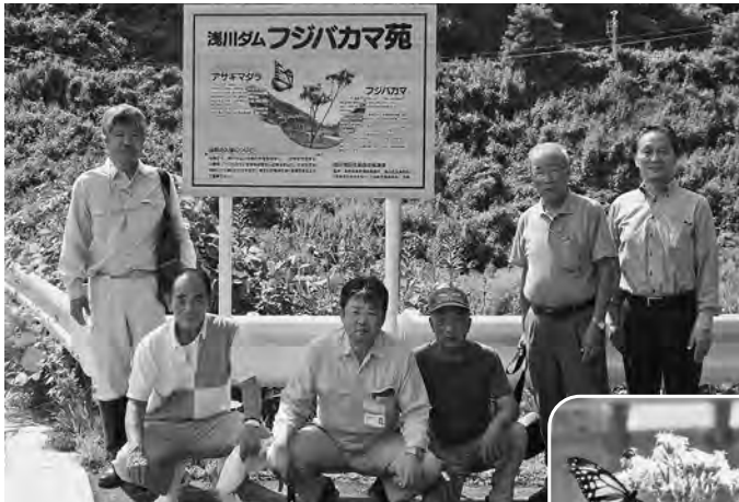
【フジバカマ苑入り口に案内板設置 ～今年もアサギマダラが訪れました！】