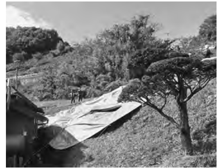
【土砂崩落があった台ヶ窪区と対応に当たる消防団】