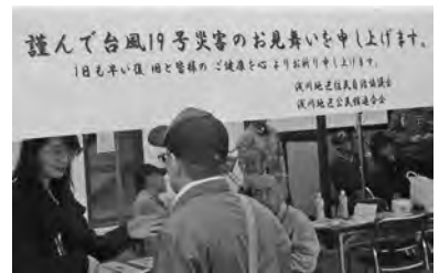
【会場では台風19号被災地区支援義援金の募集を行いました!】

外会場には例年通り各地区・団体の趣向を凝らした販売コーナーが並び、威勢の良い掛け声に今年も行列ができる繁盛ぶりで、祭りをどんどん盛り上げました。ゆうわ祭のスローガンの“お祭りパワーで地域力アップ”に加え、“がんばろう!ながの”をアピールした一日となりました。