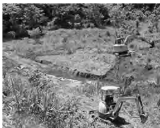
【重機が入り工事が 始まりました！】