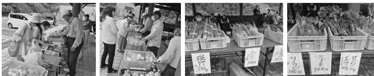
【6月20日の様子～地区の皆さんの協力で旬の野菜、山菜が揃いました！】

【今後の開催予定】7/23（土・浅川ダム祭り）、8/8（土）、9/19（土）、10/24（土）、11/21（土）