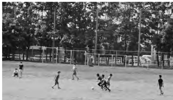
【登校するとすぐに校庭を飛び回る子どもたち】