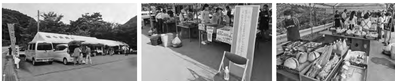
【今年はコロナ対策の消毒液も用意して開設しました】