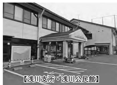
【浅川支所・浅川公民館】