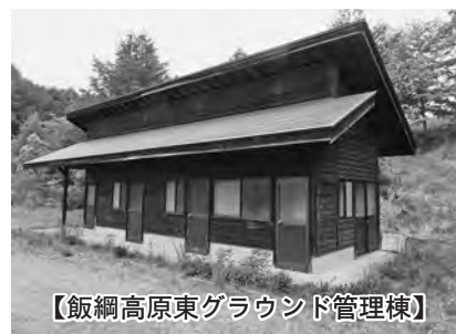
【飯綱高原東グラウンド管理棟】