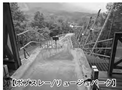
【ボブスレー/リュージュパーク】