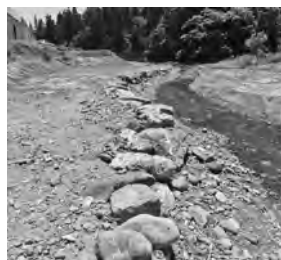
【見事に整備された河川敷 ～遊歩道からの階段も完成！！】