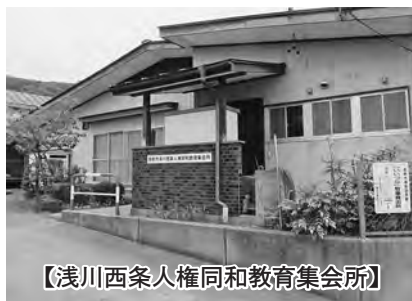
【浅川西条人権同和教育集会所】