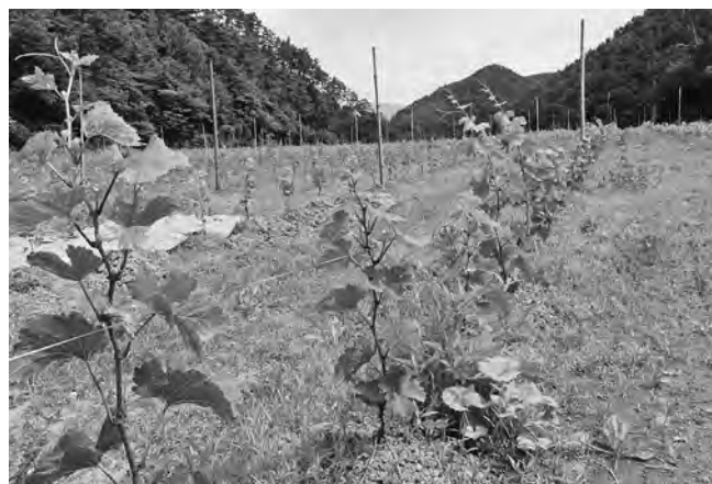
【順調に生育する苗木】