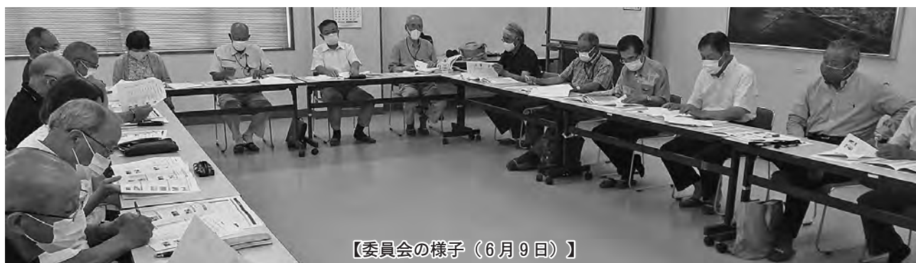
【委員会の様子(6月9日)】

施策体系は一次計画を踏まえて、①地域づくり・環境、②福祉健康、③安全防災、④教育文化、⑤産業振興の5分野とし、これまでの計画推進成果の継続・定着と新たな時代に対応するための新規課題を取り上げることになりました。また計画のための計画ではなく、できるだけコンパクトで実践的な内容に計画にしたいと意思統一をしました。