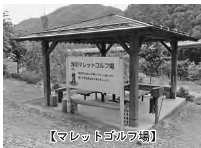
【マレットゴルフ場】