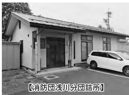
【消防団浅川分団詰所】