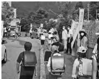
【“おはよう”の元気な声がかました！】

次世代育成部会 6 団体（青少年育成委員会・育成会・浅小PTA・北中PTA・少年警察ボランティア協会・放課後子どもプラン）と民生児童委員協議会は 6 月 16 日（火）～19 日（金）浅川小学校正門前、7 月 1 日（水）北部中学校で「あいさつ運動」を実施しました。コロナウイルス感染防止対策に伴う「緊急事態宣言」が解除され、ようやく 6 月から通常登校が始まった小学校には、ピカピカのランドセルを背負う一年生を始め子供たちの「おはようございます！！」の声がかました。