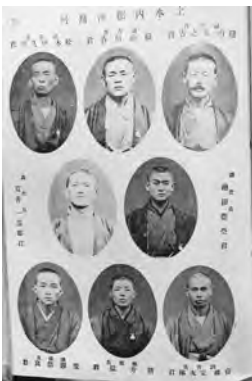
【調査員全員の写真～長野県全市町村の調査員が載っています。】

第1回の調査結果では浅川村は世帯数485戸、人口2,615人（男1,314人、女1,274人）となっています。