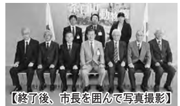
【終了後、市長を囲んで写真撮影】