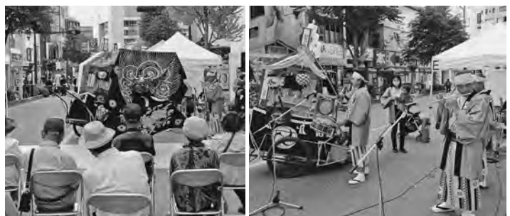
【獅子舞を熱演披露する伺去神楽保存会のみなさん】

9月19日(土)第4回目となる「ながの獅子舞フェスティバル」が開催されました。例年は5月の連休中に開かれるのですが新型コロナウイルス感染拡大の影響で9月の開催となったものです。会場となった中央通りには市内24の神楽保存会が集まり(昨年は81団体)、歩行者天国になった新田町から末広町とJR長野駅善光寺口前広場の7か所で獅子舞を繰り広げました。