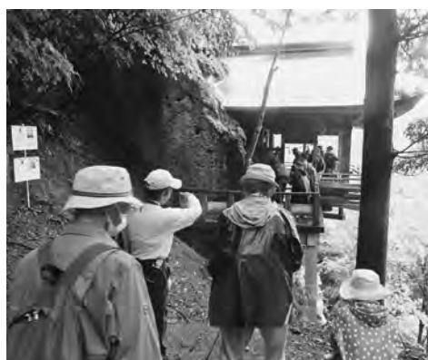
【裏参道から薬山山頂を経由してブランド薬師へ～八檜神社社殿には順番で参拝】