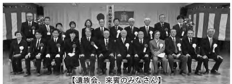
【遺族会、来賓のみなさん】