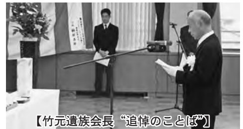
【竹元遺族会長 “追悼のことば”】