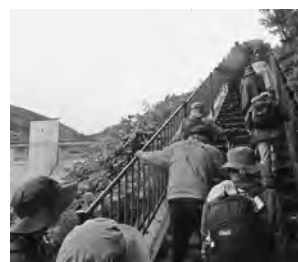
【ループラインを浅川ダム、そして急な階段を上りダム天端へ】