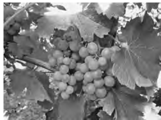
【ソービニオン・ブラン種 （白ブドウ）】

今年の長野県は多雨の長梅雨、その後の少雨高温などブドウ栽培には厳しい天候条件となり、やはり隣県を含め、長梅雨、高湿度によるカビ系病気の蔓延、結実不良、果実日焼け、裂果など多くの問題が発生した模様です。全ての農家さん、品種に大きな被害が出た訳ではなく、中には例年以上に高品質なブドウを实らせた方もいれば、品