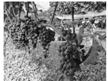
【メルロー種（黒ブドウ）】