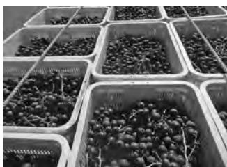
【収穫を終えて積まれたカベルネ・ソービニオン種（黒ブドウ）】