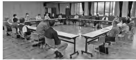
【浅川地区災害対策本部会議】

9月26日（日）昨年の台風19号災害から1年、昨年の対応の記憶を呼び戻し教訓を次なる災害への備えとして確認し強化を図ることを目的に、浅川地区災害対策本部の本部長、各班長ほか主要メンバーによる会議を開催しました。今年は新型コロナウイルス感染拡大のため防災訓練を中止にしましたが、毎年発生する災害はかつてない被害を各地にもたらしています。加えて高齢化の進む地区においては自力では避難が困難なお年寄りや一人暮らしの人も増えています。会議では避難行動要支援者名簿の有効な活用や、各人、各団体の果たすべき役割について論議が交わされました。