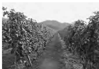
【収穫を終えたブドウ畑 （高山村・角藤農園）】