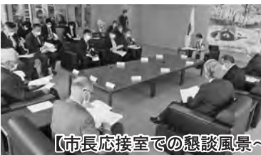
【市長応接室での懇談風景～副会長から提案説明～】

●浅川地区は中山間地・市街地がつながり、ある面で住みやすい地域。コロナ対応の中だが、市では感染予防を徹底する中ですべてのイベントを開催する方針である。地区としても積極的に活動してもらいたい。