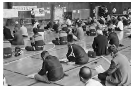
【地域防災力向上研修会】

なお午前中には長野市消防局若槻分署の主催で浅川・若槻・吉田地区合同の地域防災力向上研修会が浅川体育館で開かれ、自主防災会長・防災指導員・消防団員が参集しました。