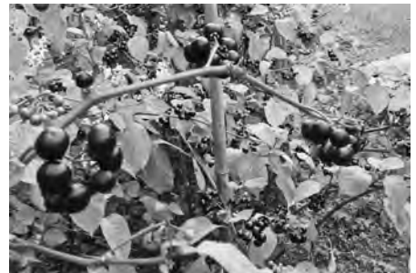
【浅川産ハックルベリージャムとハックルベリーの実】