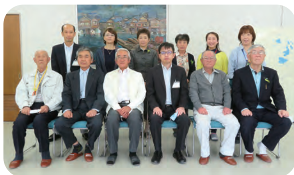
【欠席】福祉推進委員会会長・副会長 日赤奉仕団浅川分団委員長