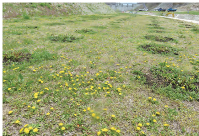
【「浅川フジバカマ苑」はタンポポが群生】