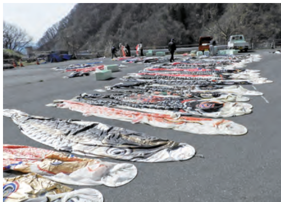
【掲揚するため鯉のぼりを点検しました（4月8日）】

今年は何とか実行したいと準備をしていましたが、感染状況は悪化の一途を辿り、4月19日長野県改良事務所より長野県が感染警戒レベル5という状況の中で