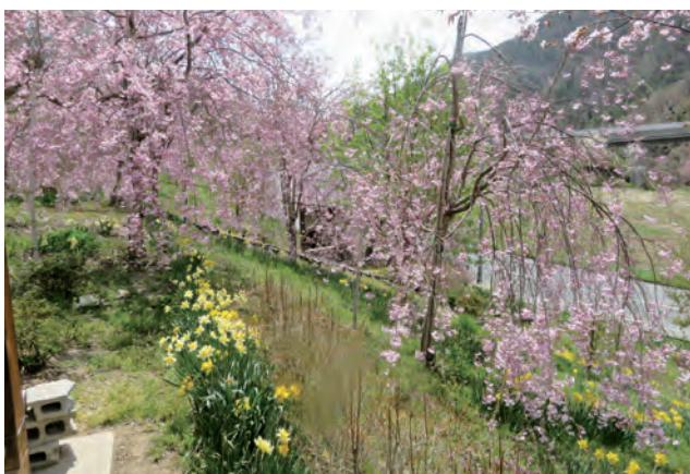
【マレットゴルフ場のしだれ桜と水仙】