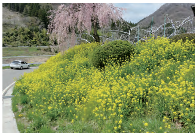
【真光寺の菜の花としだれ桜】