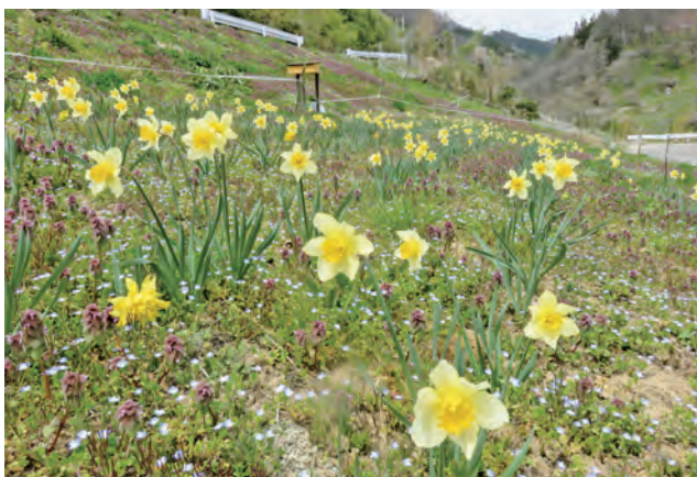
【浅川ダム河岸の水仙】