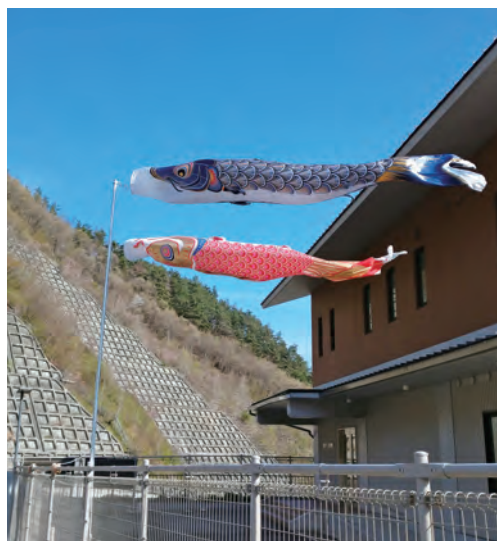
【気持ちよさそうに泳いでいます！（4月24日）】

しかし、コロナにめげず元気を出すシンボルとして少数でも掲揚したいという浅川ダム活用懇談会のメンバーの提案により4月24日ダム管理棟に掲揚しました。まだまだ終息の見通しが立たない中で、ワクチン接種も徐々に進められています。明けない夜はありません。気分転換のために浅川ダム展望広場にお越し下さい。