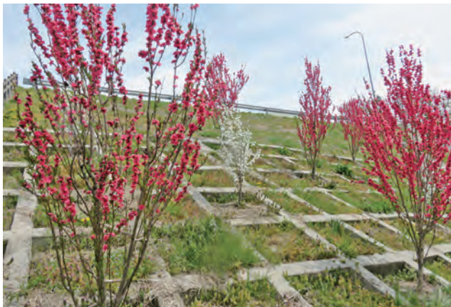
【浅川遊歩道入口のハナモモ】

浅川のまちづくり計画の中で植え付けられた桜やハナモモ、ポランティアのみなさんが植えた水仙、マレットゴルフ場の植栽など春を彩る花々が咲き乱れ、コロナ禍で閉じこもりがちな毎日に潤いを与えてくれた一日でした。