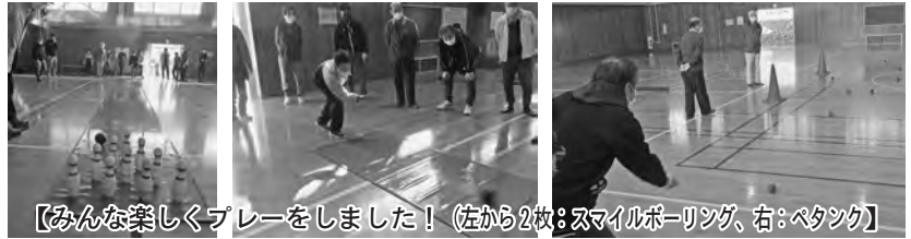
【みんな楽しくプレーをしました！（左から2枚：スマイルボーリング、右：ペタンク）】