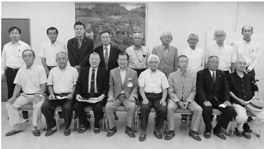
【加藤市長在任中の歴代住民自治協議会長と懇談しました！】

住民自治協議会からは「加藤市長と浅川地区の8年間」と題した写真パネルを贈り、これまでのご労苦をねぎらいました。