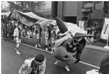
【権堂町の暴れ獅子】

獅子舞に併せて市内18の神楽保存会で作る「善光寺平神楽囃子保存会」が「御朱印スタンプラリー」を実施し、5カ所で御朱印を集めた先着千人に獅子頭のイラストなどが入った「魔除け札」を贈るなどの多彩な催しも行われ大勢の観客で賑わいました。