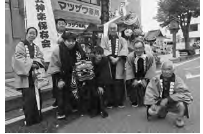
【伺去神楽保存会が華麗に舞いました！お疲れ様でした】