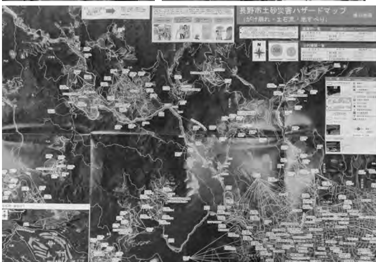
【浅川地区のハザードマップ】