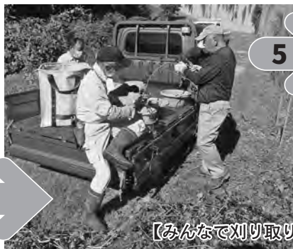
【みんなで刈り取り、実をもぎ取り……】