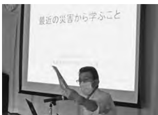
【吉原防災対策官の講演～出席者は熱心にハザードマップを確認しています！】