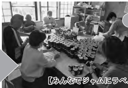
【みんなでジャムにラベル貼りして、完成しました】