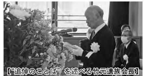
【“追悼のことば”を述べる竹元遺族会長】