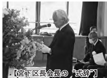
【宮下区長会長の“式辞”】