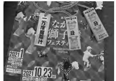
【スタンプラリー先着順に“魔除け札”進呈】