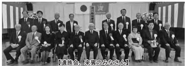
【遺族会、来賓のみなさん】