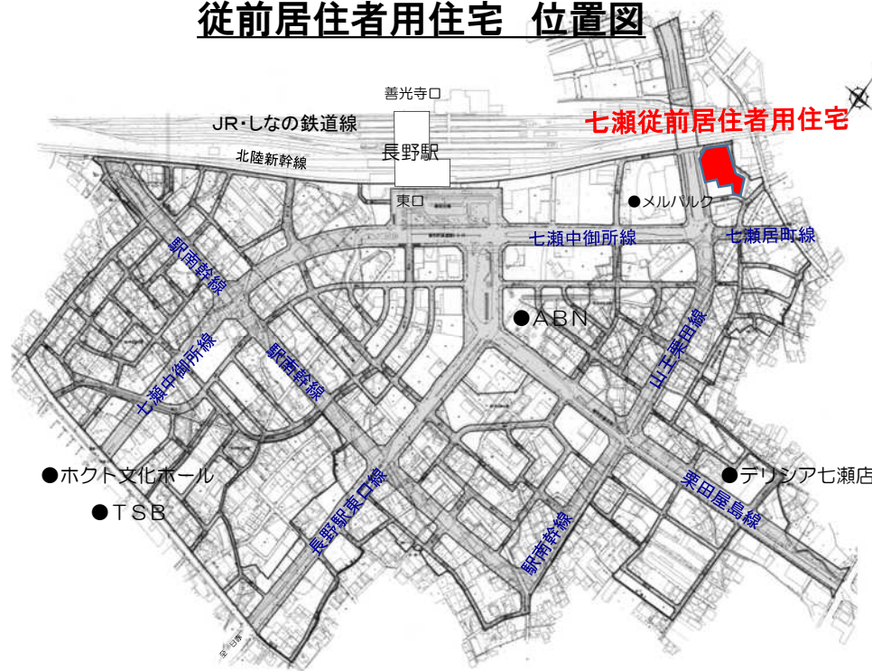
従前居住者用住宅 位置図