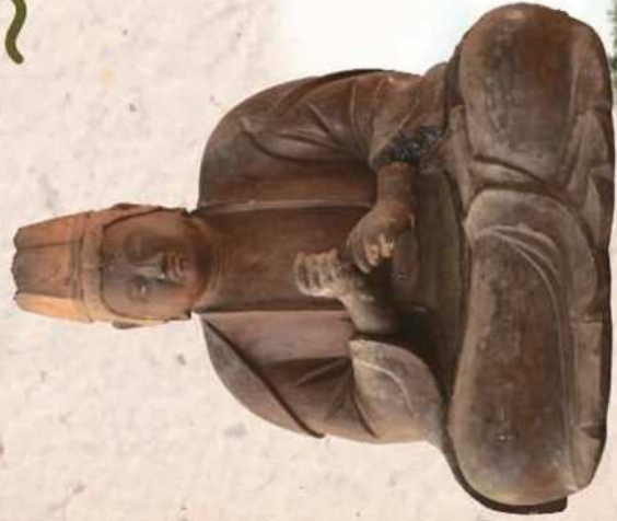
市指定有形文化財「大日如来坐像」 (皆神社所蔵)

現在まで守り伝えられてきた仏像や古文書などの貴重な資料から、皆神山周辺のいにしえの姿を紐解きます。