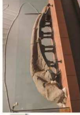
信州新町から見つかったクワジラの頭骨