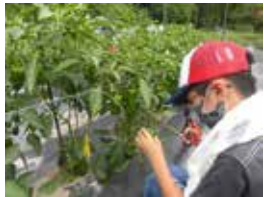
圃(一社) 市農業公社 ☎227-1650