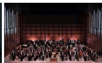
THE ORCHESTRA JAPAN