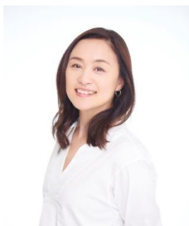
上村愛子 スキー/フリースタイル (モーグル)