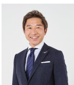
荻原次晴 スキー/ノルディック複合