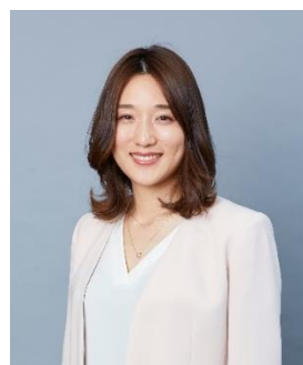
菊池彩花 スケート/スピードスケート