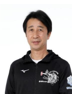
原田雅彦 スキー/ジャンプ