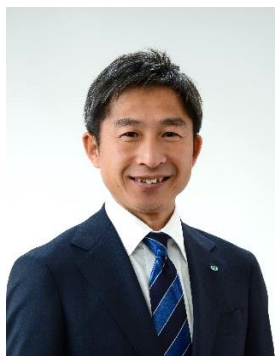
荻原健司 スキー/ノルディック複合

※参加オリンピックは変更になる場合がございます。 変更等ある場合は、公式サイト等で発表します。