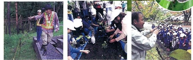
ゴマシジミの生息地を パトロール 浅川小学校では食草の ワレモコウの苗を植え替え 蝶が生息する長野市霊園 現地見学