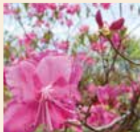
ムラサキヤシオツツジ 5～7月 駒つなぎ場～山頂