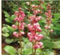
ベニバナイチヤクソウ 6～8月 一の鳥居苑地～駒つなぎ場