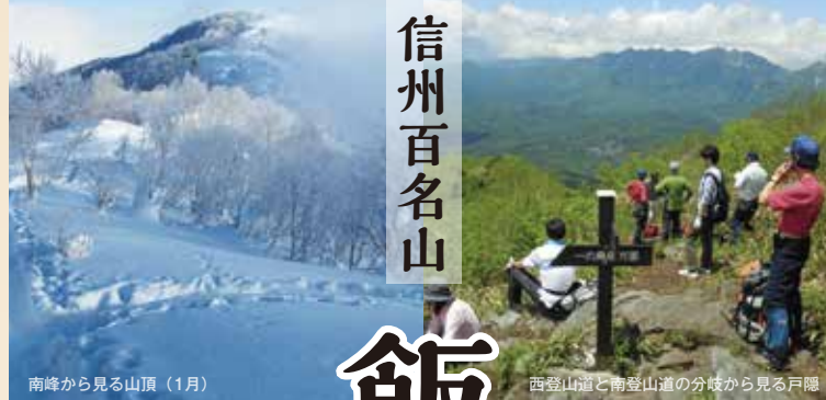
南峰から見る山頂 (1月)

飯縄高原を美しくする会 事務局 長野市商工観光部観光振興課 〒380-8512 長野市大字鶴賀緑町1613番地 TEL : 026-224-8316 FAX : 026-224-5043 e-mail : kankou@city.nagano.lg.jp (一社) 飯縄高原観光協会 〒380-0888 長野市上ヶ屋2471-84 TEL : 026-239-3185 FAX : 026-239-2934 e-mail : iizuna-k@ngn.janis.or.jp http://www.iizuna-navi.com (公財) ながの観光コンベンションビューロー 〒380-0835 長野市新田町1485-1 長野市もんぜんぶら座4階 TEL : 026-223-6050 FAX : 026-223-5520 e-mail : oмотenashi@nagano-cvb.or.jp http://www.nagano-cvb.or.jp