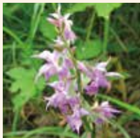
ハクサンチドリ 6～9月 南峰～山頂