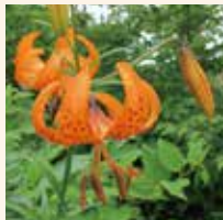
コオニユリ 7～9月 駒つなぎ場～南峰