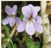
タチツボスミレ 4～7月 一の鳥居苑地～南峰