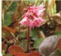
イワカガミ 5～8月 登山道入口～山頂