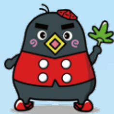
飯縄高原のキャラクター「づなっち」