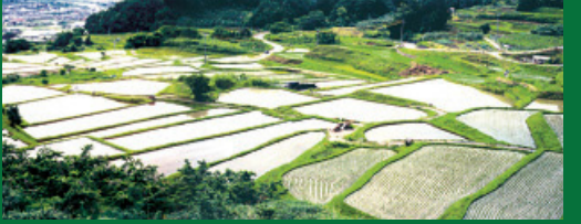
有旅の棚田(左上は篠ノ井の町)

※ゴミは持ち帰りましょう。 ※自然環境の保護にご協力をお願いします。 ※季節によっては野生生物にご注意ください。