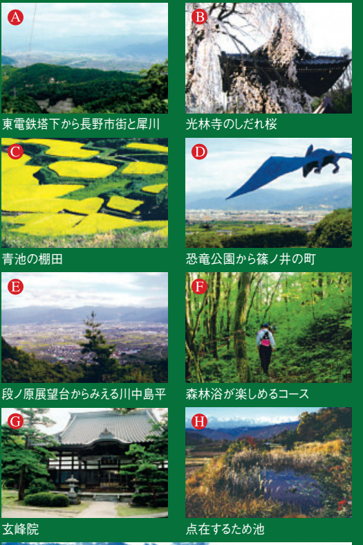
東電鉄塔下から長野市街と犀川 光林寺のしだれ桜 青池の棚田 恐竜公園から篠ノ井の町 段ノ原展望台からみえる川中島平 森林浴が楽しめるコース 玄峰院 点在するため池