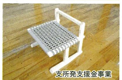
支所発支援金事業