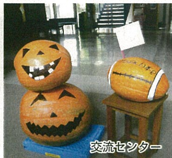
ラグビーW杯 カボチャも応援