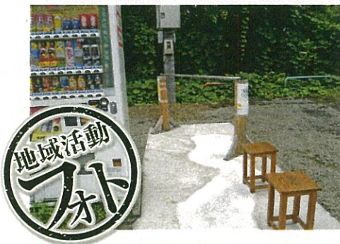
サイクルスタンド脇に休憩所