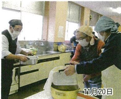
おとこの料理教室