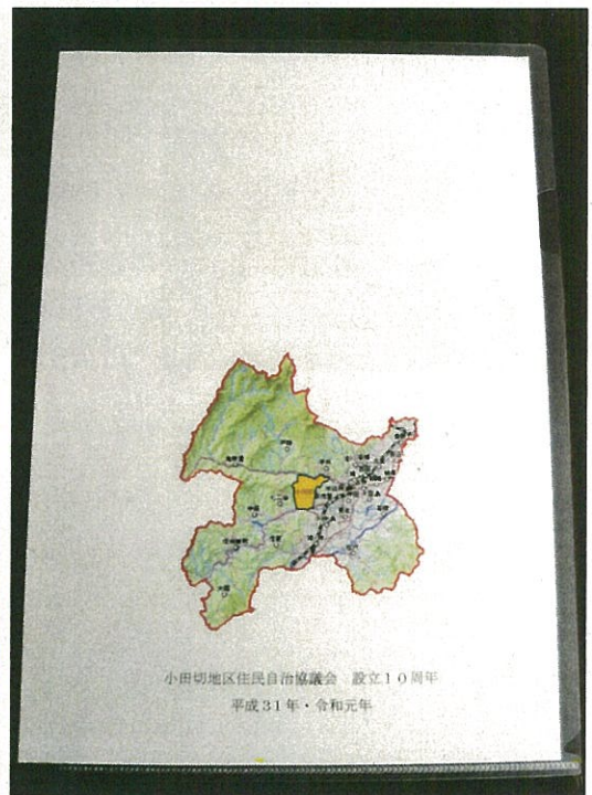
住自協10周年記念クリアファイル