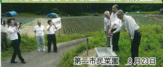
第三市民菜園 8月23日