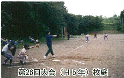
第26回大会 (H5年) 校庭

昭和42年から50年間、回を重ね42回を数えた歴史の大会がついに幕。優勝回数トップは吉窪の16回、2位は深沢と下山で各4回だが吉窪がダントツの首位で優勝率は4割近い。当初の10回は東西南北軍対抗戦での戦いでした。