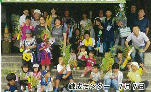
錬成センター 7月7日