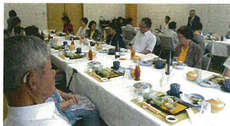
社会を明るくする運動 健康講話