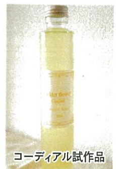
コーディアル試作品

* (株)カリス成城 本社：東京都世田谷区成城。全国に30店舗以上展開するハーブショップの老舗