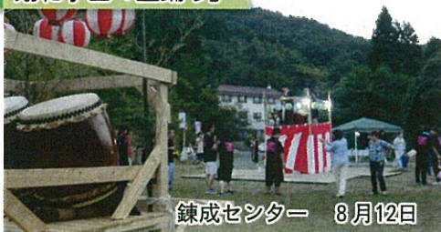
錬成センター 8月12日