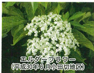
エルダーフラワー (平成30年6月小田切地区)

2016年4月以降、小田切地区等に、エルダーフラワーを定植し栽培試験(無農薬、無化学肥料)を開始。試験結果は概ね良好で、2018年7月現在約100株栽培中。