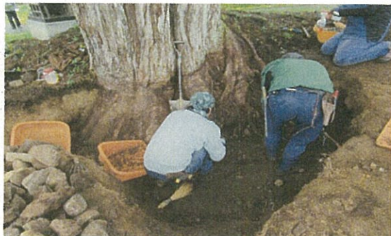
《作業_土壌改良材,菌根菌敷設》