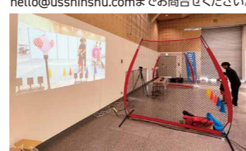
実施内容/トイドローンを操作して風船や的に 当てて勝負(1クール3名、5分ずつ交代。)

会場/総合体育館サブアリーナ 協力/アーバンスポーツ信州 参加対象/小学生以上 定員/混雑状況に応じて制限させていただきます ことがあります。 時間/11:30~13:30 お問合せ/お名前、年齢、ご連絡先を記入の上、 hello@usshinshu.comまでお問合せください。