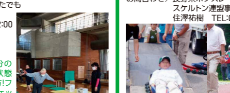
実施内容/自分の 身体や健康の状態 を確かめたい方!フ レイル予防チェッ ク、体力チェック など、身体の内外を チェックし、いきい きと元気な身体づ くりを目指しましょ!

会場/アリーナ 当日参加可 協力/スポーツ推進委員、常葉大学 参加対象/どなたでも 定員/50名 時間/9:30~12:00