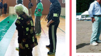
実施内容/究極の生涯スポーツ「グラウンド・ゴルフ大会」で盛り上 がる。

協力/スポーツ推進委員 参加対象/地域住民どなたでも 定員/なし(集まられた方でチーム編成) 時間/9:00~12:00