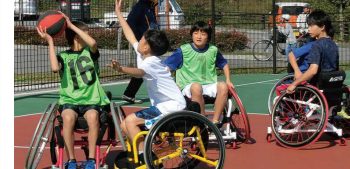
実施内容/競技用の車いすに乗って、バスケット ボールを体験してみよう!

会場/メインアリーナ 協力/K9車いすバスケットボールクラブ 参加対象/車いすで自走が可能なる方 定員/20名 時間/9:30~11:30