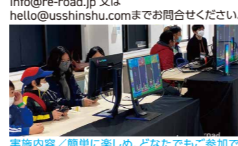
実施内容/簡単に楽しめ、どなたでもご参加 できます。eスポーツについて学び、実際に体験し てみましょう!

会場/総合体育館サブアリーナ 協力/アーバンスポーツ信州 参加対象/小学生以上 定員/混雑状況に応じて制限させていただきます ことがあります。 時間/13:30~15:30 お問合せ/お名前、年齢、ご連絡先を記入の上、 info@re-road.jp 又は hello@usshinshu.comまでお問合せください。