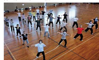
実施内容/誰でも気軽にゆったりとした太極拳 の動きを体験してみませんか

会場/柔道場 参加対象/制限なし 定員/15名 時間/受付:9:00~9:30 体験会:9:30~11:30 持ち物/運動できる服装