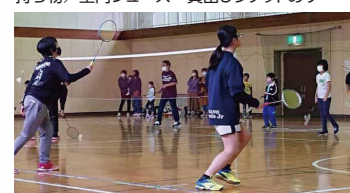
実施内容/基本技術を学んで、楽しいミニゲームを行います!

協力/篠ノ井ジュニアバドミントンクラブ 参加対象/小・中学生 定員/30名 時間/10:00~12:00 持ち物/室内シューズ 貸出しラケットあり