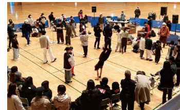
実施内容/体験会+パフォーマンス披露 9:45~ 10:15~ 10:45~ 11:15~

会場/総合体育館サブアリーナ 協力/アーバンスポーツ信州 参加対象/小学生 定員/各20名 時間/9:30~11:30(15分体験会を4回ほど) お問合せ/お名前、年齢、ご連絡先を記入の上、 choppabreakinstudio@gmail.com又は hello@usshinshu.comまでお問合せください。