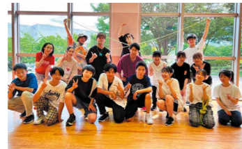
実施内容/体験会+パフォーマンス披露 9:45~ 10:15~ 10:45~ 11:15~

会場/総合体育館サブアリーナ 協力/アーバンスポーツ信州 参加対象/小学生/各20名 時間/9:30~11:30(15分体験会を4回ほど) お問合せ/お名前、年齢、ご連絡先を記入の上、 sese0627@gmail.com又は hello@usshinshu.comまでお問合せください。