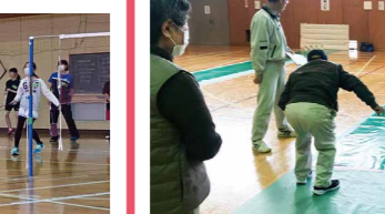
実施内容/スマイルボウリングで楽しく世代を超えて交流しよう。

協力/スポーツ推進委員 参加対象/どなたでも 定員/100名 時間/9:00~12:00