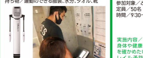
実施内容/InBody測定(体重、体水分量、部位 別筋肉量、たんぱく質量など)やトレーニングの 質を高めるプログラムです。

参加対象/一般の方 定員/各6名 申込 A 時間/①10:00~11:00②11:00~12:00 持ち物/運動のできる服装、水分、タオル、靴