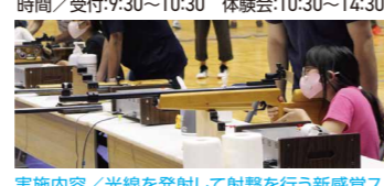
実施内容/光線を発射して射撃を行う新感覚ス ポーツ!ビームライフル、ビームピストルを使って 射撃を楽しもう!初心者も丁寧に指導します。

会場/メインアリーナ 参加対象/小学4年生以上の方 (小学4~6年生は保護者同伴) 定員/45名 時間/受付:9:30~10:30 体験会:10:30~14:30