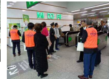
長野駅前での啓発