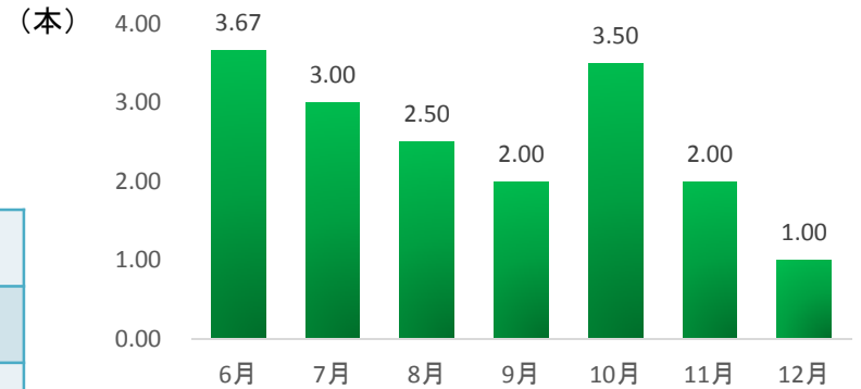
夜間パト時の歩行喫煙者数の推移(6月～12月)