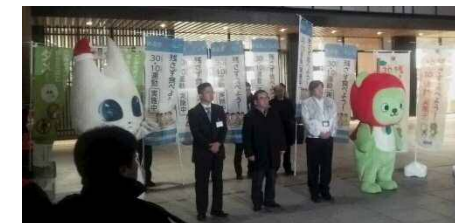
市内循環 街頭啓発出発式