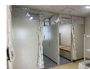
改修された女性用仮眠室

将来にわたり防災拠点としての役割を維持するため、消防庁舎の長寿命化のために改修工事を行います。