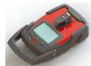
化学剤の判定装置