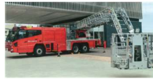
最新型はしご車 (※イメージ)