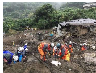
静岡県熱海市土砂災害現場での活動