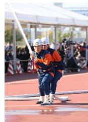
全国消防操法大会 長野市消防団初出場 (小田切分団)