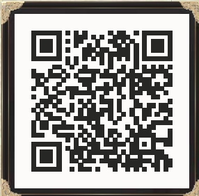
【川中島の戦い総合サイト】