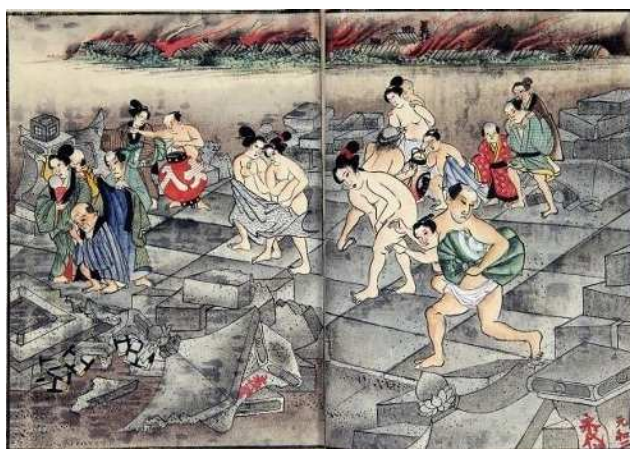
地震後世俗語之種 (真田宝物館蔵)

弘化4(1847)年の旧暦3月24日に北信濃を襲ったマグニチュード7.4と推定される直下型地震。地震によって倒壊する家屋の下敷きや各所で発生した火災に巻き込まれ、数千人の犠牲者が出たとされる。おりから善光寺では居開帳が行われ、全国から多数の参詣客が集まっていたこともその被害に拍車