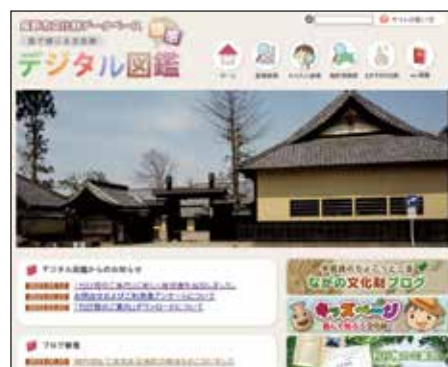
文化財データベース 「頭で感じる文化財デジタル図鑑(頭感)」

また、文化財の修理途中での現地説明会、調査報告書の発行や講座等の開催のほか、通常は非公開の