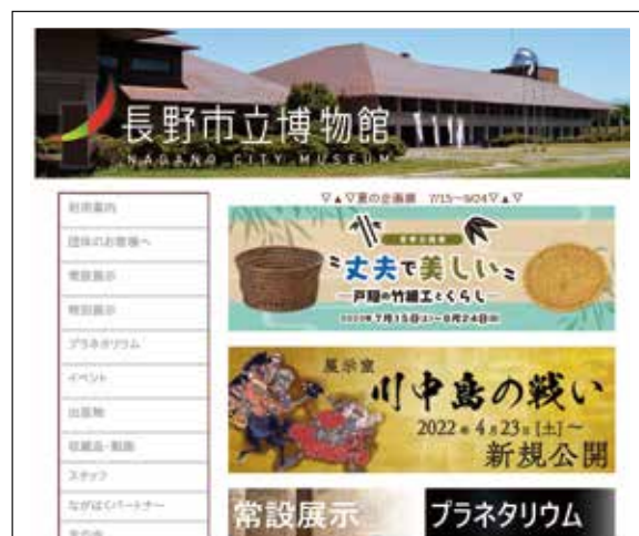
長野市立博物館のホームページ

また、天体観測室やプラネタリウムが設置されており、自然科学の情報発信拠点としても機能している。