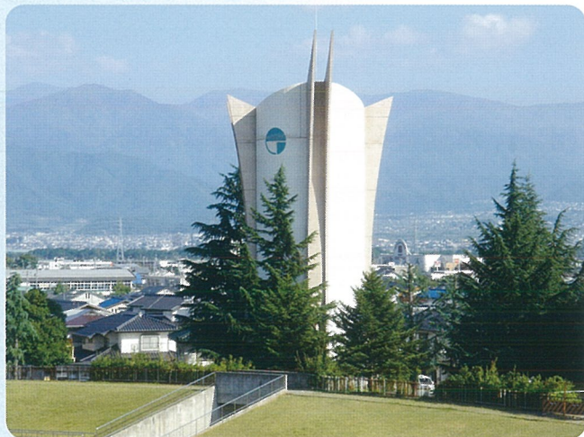
▲ 長野運動公園の緊急貯水槽

災害などの緊急時には、緊急貯水槽や配水池等により全市民の1週間分（1人当たり約90ℓで算出）の飲料水が確保できるようになっています。