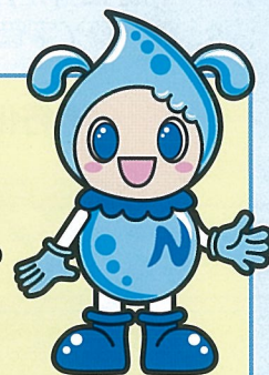
上下水道局イメージキャラクター みずなちゃん

12月1日に上下水道局公式ホームページを開設！ 皆様のアクセスをお待ちしております。