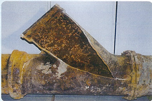
平成12年7月5日破裂 (昭和通り市民会館前) 鋳鉄製Y字管 直径500mm (昭和36年布設)