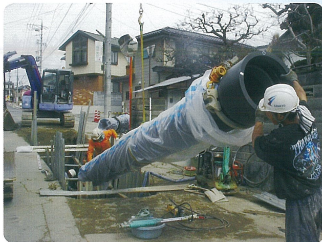
▲ 老朽管の更新工事の様子

長野市上下水道局では、安心・安全な水道水を安定的にお届けするため、布設年度や重要度などを考慮しながら長期間の事業計画を作成して、老朽管の更新や水道管の耐震化に取り組んでまいります。