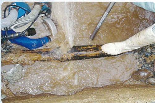
平成24年1月19日破裂 (東東通り) 鋳鉄管 直径150mm (昭和42年布設)