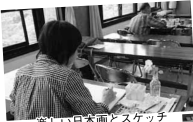
楽しい日本画とスケッチ