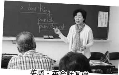
英語・英会話基礎