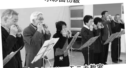
たのしいハーモニカ教室