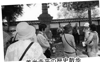
善光寺平の歴史散歩