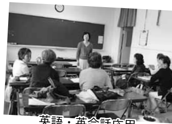
英語・英会話応用