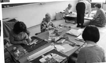
パッチワーク・キルト