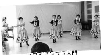
ハワイアンフラ入門