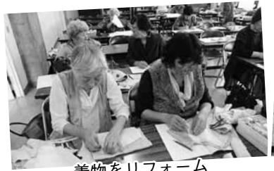
着物をリフォーム