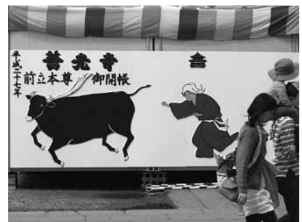
おばあちゃんも回向柱に触れるといいね