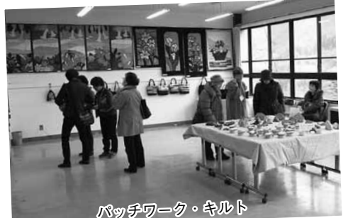
パッチワーク・キルト