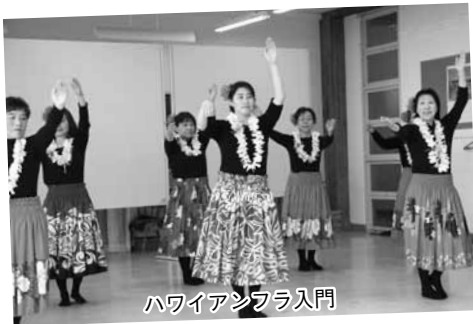
ハワイアンフラ入門