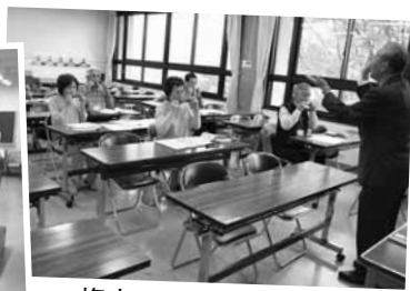
複音ハーモニカ初級