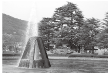
現在の城山公園噴水

のは現在では当然のことですが、そうなるまでの苦労、水を得た喜びがこの噴水にこめられています。今回は、そうした物語を紹介していきます。