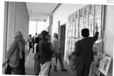
善光寺平の歴史散歩