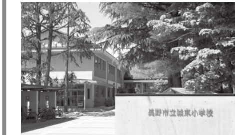
60周年を迎えた城東小学校

に積極的に参加しておられます。住宅の増加等に伴い、昭和30年に城東小学校が開校され、今年でちょうど60周年を迎えます。この