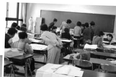
着物をリフォーム