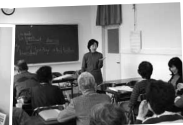
英語・英会話基礎