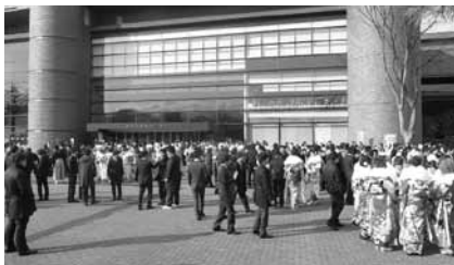
ホクト文化ホールに集う新成人