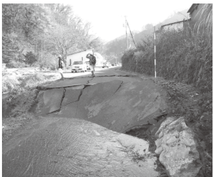
白馬地区の地震断層

にあわれた方がいらつしやいます。つっしんでお見舞い申し上げます。 今回の地震は白馬村の神城断層が動いたもので、小