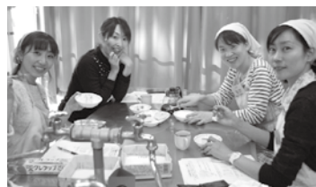
とっても簡単・とってもエコ・とってもおいしい

今回は託児も併設したため、若いお母さん方がたくさん参加してくれました。初めは泣いていたお子さんもしばらくすると笑顔で遊んでいて、保育士の先生方には本当に感謝です。来年度も楽しい