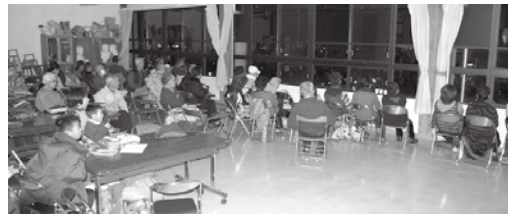
暖かい会場でえびす講花火見物

そうだ、今回は日ごろお世話になっている来館者の皆さんに感謝の意味を込めて、5名の職員一同で演者に