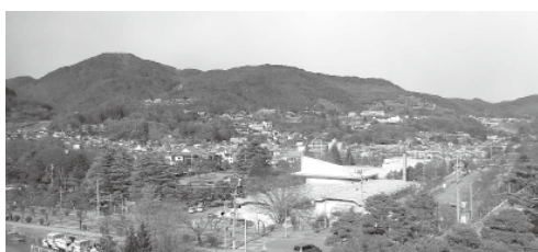
城山公民館屋上より

このように、城山公民館周辺の山や谷・丘や川も基本的には大地の動きによってでき、その後人々が暮らすようになった場所です。今回の災害だけでなく、これからその動きが見られる場所だと思っています。災害時に被害を減らし、上手に暮らすためには、自分たちの足元をもう一回見直してみることが大事なことでしよう。(次回は「城山に大噴水がある理由」です)