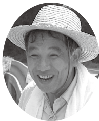
戸隠地質化石博物館