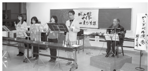
今宵の演者は5人の職員です