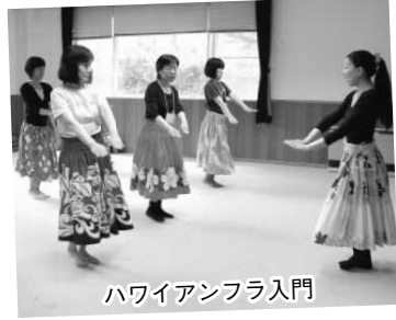
ハワイアンフラ入門