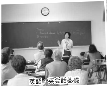
英語・英会話基礎