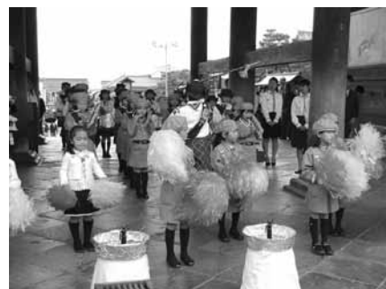
花まつりで演奏するガールスカウトの皆さん