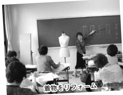
着物をリフォーム