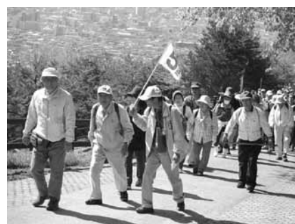
第二地区 地附山トレッキング