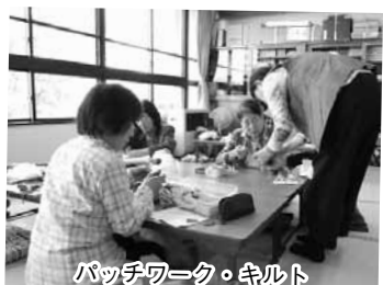
パッチワーク・キルト