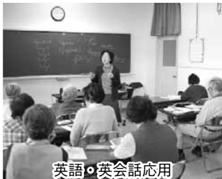
英語・英会話応用