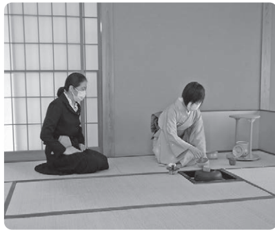
茶道【火】講座 お茶席