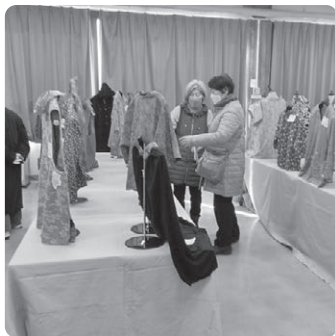
楽しくソーイング講座