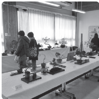
悠遊 BONSAI「盆栽」・四季に愛される盆栽とわたし講座