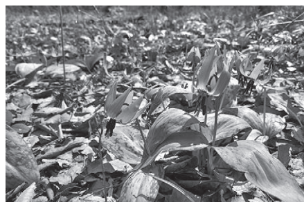
可憐なカタクリの花

裾花川右岸の里島発電所北側に、2〜3万株のカタクリ群生地がある。今年は記録的に早い開花で3月下旬に満開となった。(平年は4月上旬〜中旬に満開)