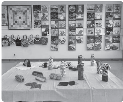
パッチワーク・キルト講座

去る2月17日・18日の2日間、令和4年度の成人学校に集う受講生の学びの成果を発表する機会として、「成人学校作品展」を開催しました。期間中、多くの皆様に来館いただき、様々な作品や発表を鑑賞いただきました。ありがとうございました。今回、その一部を紹介いたします。