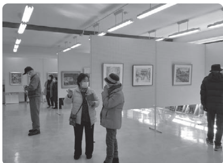
洋画・洋画「人物画」講座