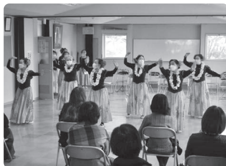
楽しくハワイアンフラ講座