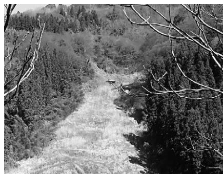
七久保地滑り (芋井地区)

落も点在していて、裾花川を境に北側が芋井、南が小田切地区となっています。館報 194 号で紹介した鬼無里と同様、この一帯が比較的軟らかい泥や砂の地層でできていて、地滑りを起こしやすく谷が広くなっているのです。そうした地滑り地には水が湧き、そこには人が住むことが