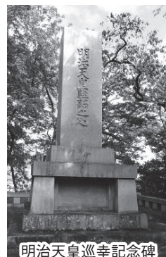
明治天皇巡幸記念碑

城山のトンネルは、長野市街では珍しい花崗岩（御影石）を使ったアーチ状の石組みが特徴のトンネルです。いつ作られたのかを調査してみると、周辺の整備の一環で作られたものだ、ということがわかってきました。前回、昭和7年から12年にかけての道路「御幸橋横山線」の整備の