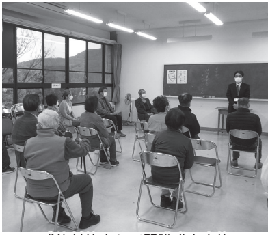
感染対策をして開講式を実施

令和3年度の城山公民館成人学校は、予定どおり4月に開校いたしました。本年度は全28講座中、26講座の開講となりました。感染症対策の関係から本年度の開講を見送った講座が2つありましたが、次年度再度募集の予定です。(下表参照) さて、昨年度は新型コロナウイルスの関係で、大幅に開講が遅れましたが、本年度は例年どおり4月に開講することができました。今まで当り前に思っ