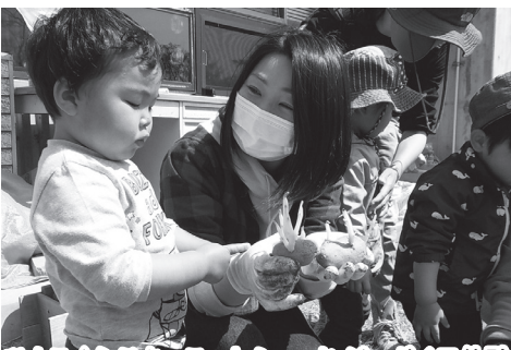
体験ジャガイモの袋栽培を体験する幼児