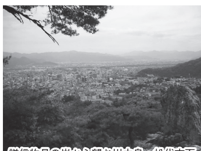
謙信物見の岩から望む川中島・松代方面

戦国時代、横山城 (現城山公民館付近) に布陣し川中島の戦いに臨んだ上杉謙信は、この岩から川中島の武田方の動きに目を光らせた。手前は長野県立美術館。