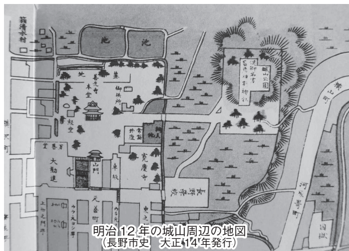
明治12年の城山周辺の地図 (長野市史 大正14年発行)

一環で作られたものではないか、という仮説を紹介しました。当時、昭和の大恐慌後で、この道路整備も失業対策緊急事業だったとのこと。しかも、この工事の期間中の昭和9年には皇太子（現在の