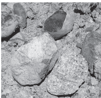
一緒に出土した石ころ

これら、巨石と一緒に掘り出された石ころの中には、白っぽい岩で黒雲母や石英の粒を含むもの、灰色で黒い輝石の粒を含むもの、黒くてち密なものなどが目立ちます。また、黒くてキラッと光る角閃石や白い長石、透明な石英の粒を含みちよつと緑色に変質した半深成岩類が確認されました。そのほかに、砂岩や泥岩、チャートなどの硬い石ころもありました。