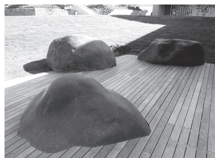
美術館前に設置された磨かれた巨石

これらの石ころの「顔つき」から、それぞれの出身地を推定します。白い石ころ（流紋岩）は大峰山や旭山をつくる裾花凝灰岩層の一部です。灰色の石ころは飯縄山の溶岩類です。ち密で黒い石ころは芋井や戸隠、小田切に分布する海底火山の溶岩類に由来するものだと思います。粒が目立つ緑色の石ころは、戸隠連峰高妻山周辺の貫入岩類によく似ています。これらの石は、現在の裾花川の河原にあるものとよく似たものでした。併せて、美術館建設に先立つて行われた地質調査用のボーリング資料も観察しました。これらの資料中にも、やはり裾花川が運んできた石ころが含まれており、3 個の巨石が裾花川によって運ばれてきたことが確かめられました。これらのことから、城山公園一帯にはかつて裾花川が流れていたこと、こんな巨石が上流の戸隠や飯縄山から運ばれてきたことが明らかになりました。2 m を超える巨石が運ばれるには、かなりの水量であったことが推定されます。大規模な土石流が発生したのでしょうか？