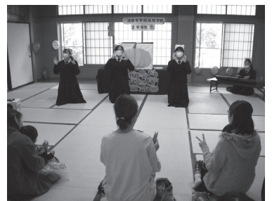
手遊び歌を楽しむ親子

部屋めぐりを終えた後は、清泉女学院高等学校生徒と手遊び歌と一緒に楽しみました。それから、ペープサートの人形劇を鑑賞しました。かわいい人形の動きを食い入るように見つめる子どもの姿が、とても愛くるしく微笑ましいひと時でした。