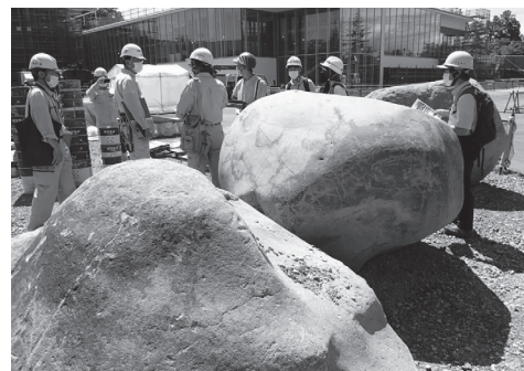
掘り出された巨石

その仮説を証明するために、石ころが掘り出された現場でもっと証拠を集めることが必要です。工事の現場責任者からも話を聞き、この巨石を掘り出した時の土砂を積んだ山でも現場検証をしました。