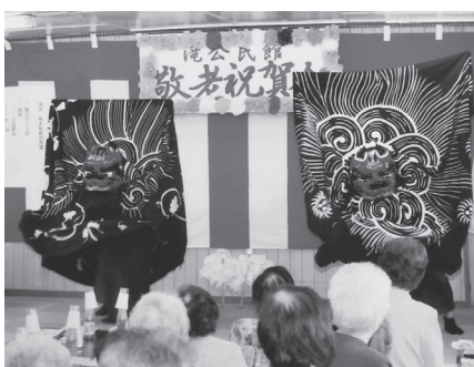
敬老祝賀会（元年9月）滝公会堂

主催）、「地附山春のトレッキングイベント」（地附山トレッキングコース愛護会の会長・顧問とも滝在住）に参画。 6月「第二地区ソフトボール大会」 9月「滝区敬老祝賀会」 11月「パーベキュー祭り」（育成会と共催）、「三世代餅つき大会」、「滝区役員研修」、「慰労会」（開催日未定）、「人権問題研修会」（城山団地合同） 以上、令和3年度公民館事業予定を紹介しましたが、2年余りに及ぶコロナ感染症により、昨年同様、多くの事業を中止せざるを得ませんでした。一日も早くコロナが収束し令和4年度は各事業の成功を願うばかりです。