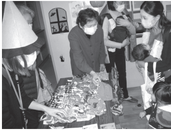
ハロウィンバッグをもらう幼児

受け付けでは、公民館成人学校「パッチワーク・キルト講座」の受講生が、手作りしたハロウィンバッグを笑顔で