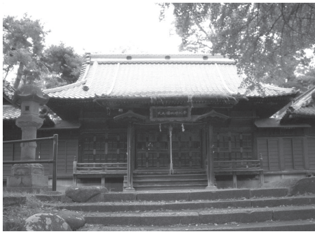
健御名方富命彦神別神社

ました。この付近は、かつて横山城が築かれ、上杉勢が陣取った山城が置かれていました。14世紀頃、横山城の主郭は、現在の健御名方富命彦神別神社のある場所にあり、善光寺を守るために、守護方が築いた城であったと考えられています。この地は明治天皇の言葉どおり、周囲を広く見渡せる絶景の地であるとともに、善光寺の守衛はもとより、北信濃の覇権を争う当時の武士たちにとって、戦略的にも大変重要な場所であったことは間違いありません。 さて、かつて善光寺本堂の北側には年神堂として祭られた由緒ある社があり、その昔は御神位が正二位に位置付けられるほどの大社であったと言われるほどです。しかし、明治期の神仏分離の影響もあり、昔の面影をしのぶことができないほどの状態になっていました。明治11年（1878）、湯福・武井・妻科神社の氏子が信徒となって神社創建を願ひ、敷地を城山に求めて翌12年に認可されました。そして、県社となつた健御名方富命彦神別神社へ年神堂の本殿を遷し遷宮祭を行いました。こうして、横山