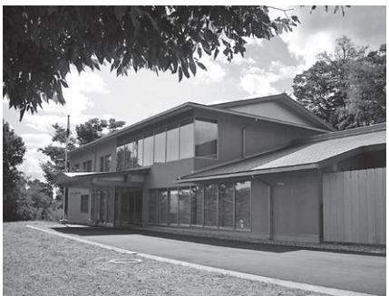
令和の長野県神社庁舎

さて、長野県神社庁は、このたびの城山公園再整備事業の中で、再び移転することになりました。場所は、健御名方富命彦神別神社の東隣で、善光寺平を一望できる城山公園一番の高台です。この神社は、かつて県社として、また、「延喜式」で信濃国水内郡大一座とされた歴史ある神社です。くしくも、この地に位置するようになったことは、長野県神社庁にとって、まさに象徴的な移転といえるのかもしれない。