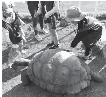
カメラに餌をあげる子どもたち

10月14日(土)午後、城山動物園に8組22人の親子が集まりました。この日は、ふだんなかなか体験できない、獣舎内見学や動物園の飼育員の側探検・餌やり体験を行いました。また、通常は入れない動物病院・飼料室も見学し、動物の豆知識等を学ぶことができました。体験後の子どもたちの感想は、全員が「楽しかった。面白かった」と答えていました。