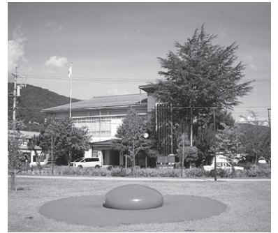
昭和時代に建てられた神社庁舎

そして、長野県庁内に置かれた神社行政に関する事務局等も廃止され、神社は民間の普通の宗教団体に改組されることになったのです。このような社会情勢の中で、翌昭和21年3月に、長野県神社庁が設立され、同年5月6日には、長野県神社庁発足の声明が