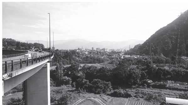
頼朝山トンネル出口付近から見る風景

鬼無里方面から国道406号を市街に進むと、平成21(2009)年に供用開始となった頼朝山トンネルがあります。その東側の出口、茂菅大橋にでると景観が大きく変わります。ずっと谷沿いを通り過ぎてきた国道ですが、トンネルを抜けた途端に空が開け、長野の中心市街地とその背景に群馬県境の四阿山(標高2354m)等を望むことができます。