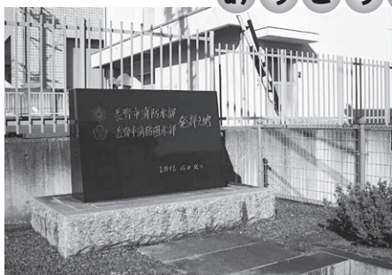
長野市消防本部・消防団本部発祥地碑(若松町)

長野市消防本部・長野市消防団本部は、昭和23年(1948)に若松町に置かれた。現在は両本部発祥の地として記念碑が置かれている。