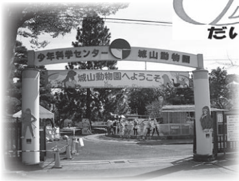
▼長野市城山動物園