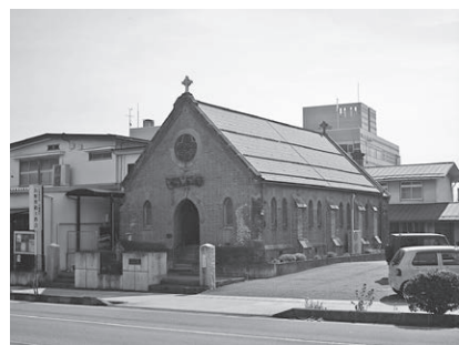
長野聖救主教会 (西長野)

長野聖救主教会は、明治31年(1898)に、中世ヨーロッパのゴシック建築様式により建てられた。