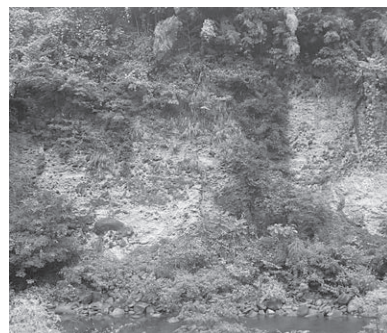
長野商業高等学校野球部グラウンドの東側の崖