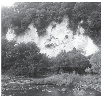
長野県庁裏の白岩

中心市街地は、山際の地下にある長野盆地西縁断層が境となつて、沈んだ盆地側に裾花川が運んだ土砂が堆積した「新しい地層」でできています。ここという「新しい」とは、約20万年前より新しい時代の地層という意味です。その地層を観察できるのが、長