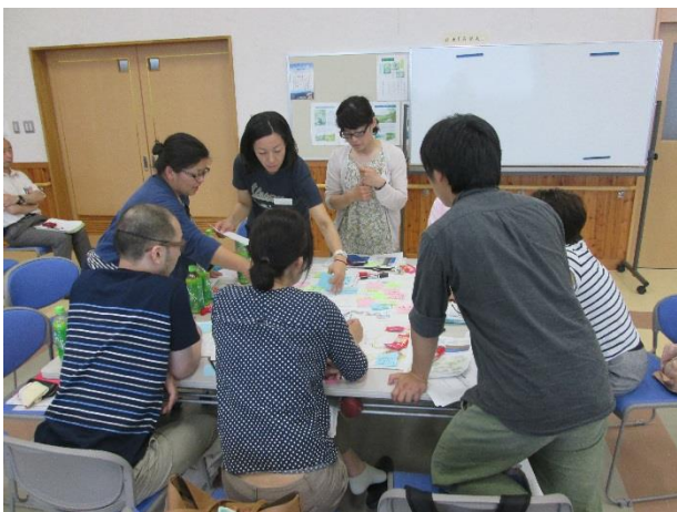
グループ討議の様子 熱心に話し合っていました