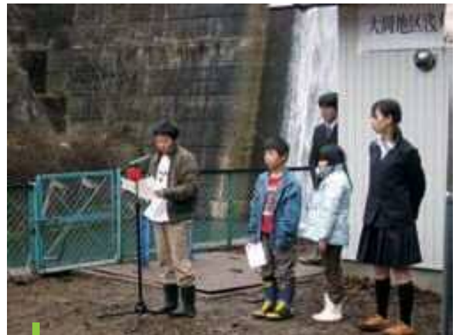
竣工式で大岡小・中学校の児童達が作文を発表