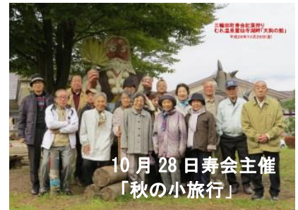
10月28日寿会主催 「秋の小旅行」

色づき始めた飯綱高原「天狗の館」にて → 薄霧がたちこめ静寂な高原の景色は東山魁夷画伯の絵を想わせる様でした。温泉と懇親会で親睦を深め楽しい一日でした。