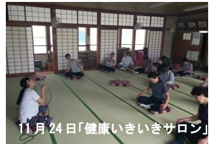
11月24日「健康いきいきサロン」

この日は1周年目でもあり、ヨガの後、介護予防出前講座「元気の源は、お口から！」を学びました。 →