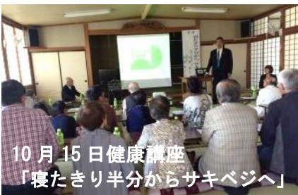
10月15日健康講座 「寝たきり半分からサキベジへ」

←医食同源の立場から食事と健康の相関関係のお話を伺い、既成観念を覆す目からウロコのお話を聞き改めて納得出来ました。