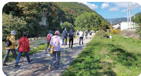
福祉健康部会 ノルディックウォーキング