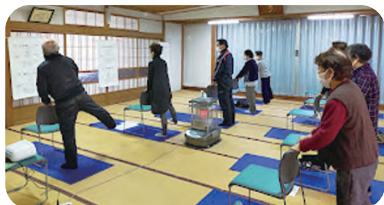
はつらつ体操で健康の維持増進と脳トレ・交流