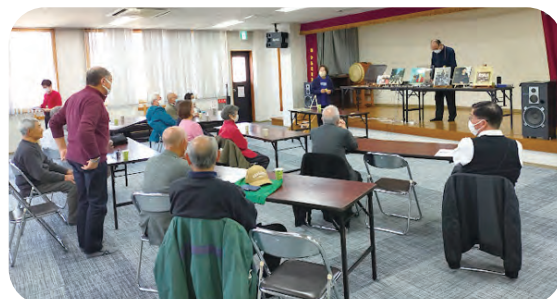
福祉健康部会 サロンdeレコード