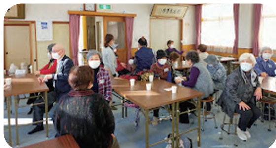
お茶のみサロンで住民同士の交流を図ります