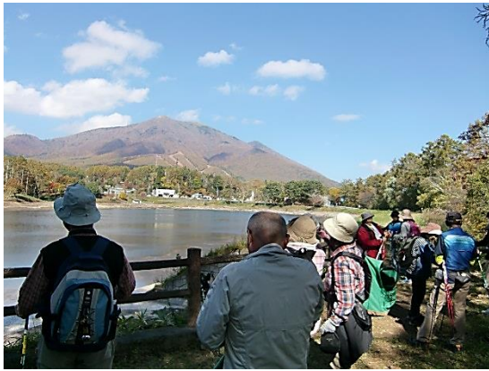
↑ 休憩場所から望む飯綱山 3 km・6 kmコースの様子⇒