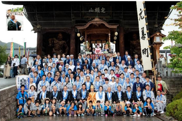
令和元年ながの祇園祭 御祭礼屋台巡行記念 令和元年 7月14日（日）