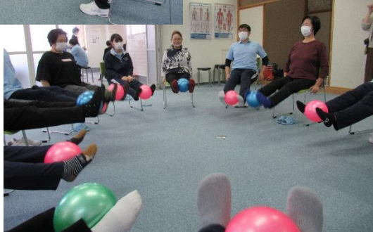
ゴムボールを足に挟み、膝の曲げ伸ばし運動

令和元年5月に連携協定を結んだ、三輪田町にある信州スポーツ医療福祉専門学校と共催で「介護予防運動講座」を10月26・27日に実施しました。専門学校は授業の一環として、介護福祉学科2年生24名が2グループに分かれ、1グループごとに2日間実施。地域住民を対象にゴムバンドやボール、バランスマットを使ったフロア運動や、種類の違う4台のマシンを使った運動等を指導していただきました。