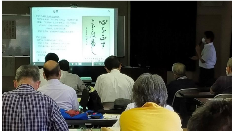
善光寺大本願前御上人の筆による「心を正すことは易し」の額

現在、非行件数は戦後最少である一方、「発達障害」「被虐待経験」を持つ少年の割合は増加しているそうです。『鑑別所に入る子どもは「生きづらさ」を抱えている。「生きづらさ」=環境の過酷さが非行として表れており、子どもが幼少期に虐待を受けると前頭葉が小さくなり自己統制力が弱くなる(=キレやすくなる、集中力が低下する)』とのこと。非行防止のポイントとして、あいさつやお礼、謝る、約束を守ること等を基本に、指示ははっきりとわかりやすくする。守れない指示は出さないこと。最後に「よくできたね、ありがとう」などの肯定的なフィードバックを欠かさず、優しく接することが大切ということでした。