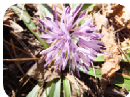
ショウジョウバカマ