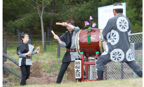
セレモニーの緋桜太鼓の演奏