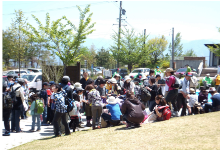
受付、準備体操を済ませ出発を待ちます