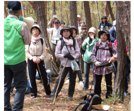
愛護会の皆さんによる説明を聞く