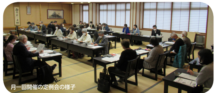
月一回開催の定例会の様子