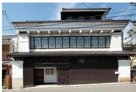
鳥蔵別邸東屋（東町）

長野市景観賞に大門町の長野信用金庫大門町支店、景観奨励賞に東町の鳥蔵別邸東屋と、第二地区内から2つの建築物が選ばれました。みなさま、近くを通った際は、是非ご覧ください。