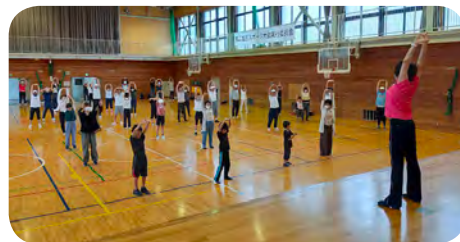
ラジオ体操講習会風景