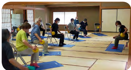
柔らかなボールでおしりから足先まで軽くたたいて足全体をほぐします。

10月24日には足からの健康講座に加え、屋外でお散歩を実施します。皆様のご参加をお待ちしています。