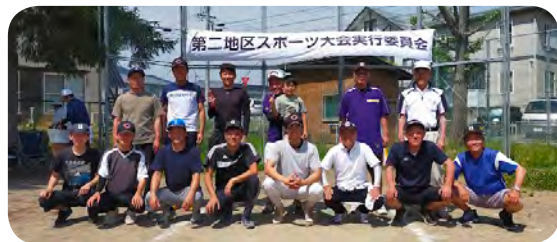
ソフトボール優勝 上松 A チーム

※ 7月9日に予定していたジョギング・ウォーキングは、雨天のため中止となりました。