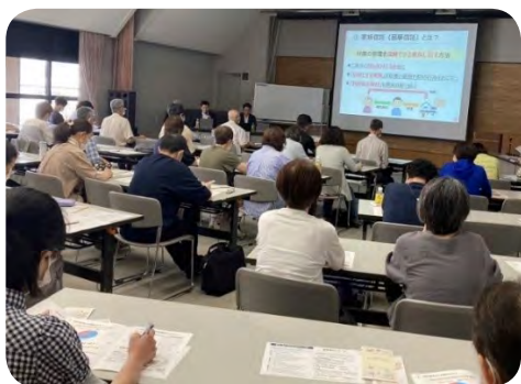
6月28日 学習会「障がいのあるわが子の行く末を誰に託したら『信託』ケース検討会」に参加

長野市では昭和37年に知的障がいのある人の「親の会」として結成され、半世紀にわたり障がいのある人の支援の拡充を目指し活動しています。現在は「長野市手をつなぐ育成会」として市内に6つのブロック(東部・中部・西部・南部・篠ノ井・北部)があり、それぞれにいくつかの支部があります。