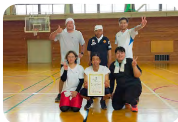
ビーチバレー優勝 箱清水チーム