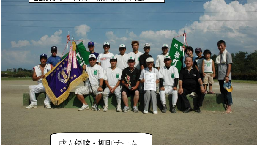
成人優勝・柳町チーム