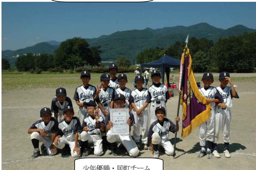
少年優勝・居町チーム