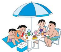
22.8.22 少年少女水泳大会