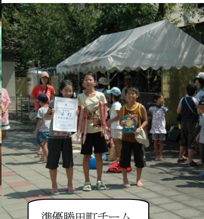
準優勝田町チーム