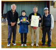
準優勝： 緑町チーム