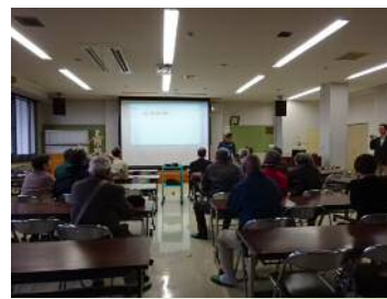
救助や訓練の様様を聞く