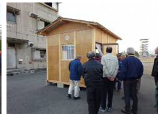
消火訓練用の建物

2番目の視察場所は県の消防学校で、設備の説明、災害や火災時の救助活動の状況、訓練模様を説明頂きました。災害や、火災は起きないに越したことはないのですが、日頃からの備えが肝心だと改めて考えさせられました。