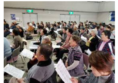
ピアノの生演奏で合唱