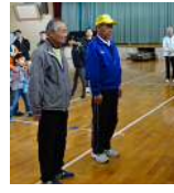
3位：上千歳町 A チーム

11月18日(日)鍋屋田小学校体育館に於いて、10町17チームの登録選手70名と、子供たちやご家族等の応援団含めて約100名の参加で実施されました。今回は子供達や女性の参加が増え世代間の交流も定着して、ベテラン選手とのフルセットの大熱戦を繰り広げ大いに盛り上がりました。優勝は上千歳町Bチーム、準優勝は緑町チーム、3位は上千歳町Aチームとなりました。次回も老若男女問わずより多くのチームの参加をお願いします。