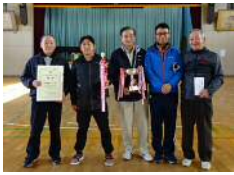
優勝：上千歳町 B チーム