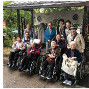
ぴんころ地蔵の前

9月25日(火)車椅子に乗ったまま乗降ができるリフト付きバスで、佐久市まで小旅行に出かけました。参加された皆さんは、なかなか遠出ができないから楽しみにしていたと、会話が弾んでいました。ぴんころ地蔵ではボランティアガイドさんの軽妙なトークに笑いと感嘆の声が上がりました。栄養価の高い鯉料理も美味しく「来年も参加できるようにリハビリを頑張る」という力強い声も聞かれました。来年のご参加お待ちしております。