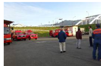
歴代の消防車の展示