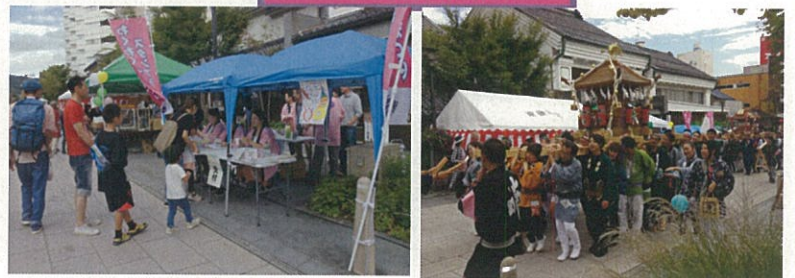
⑩ 10月6日 東後町 表参道秋祭り