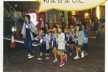
④ 9月10日市役所隣 菊屋稲荷神社