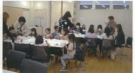
子ども達による食事作り体験会