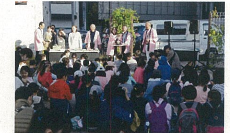
子ども達全員でビンゴ大会

大人気のビンゴ大会も長野東急さん、イトーヨーカドーさんの協力で楽しい賞品も並び、大変盛り上がりを見せました。参加して下さった子供団体の皆さん、ボランティアでご協力いただいた県立大学の学生さんや町の福祉推進員、役員の皆さんに感謝です。