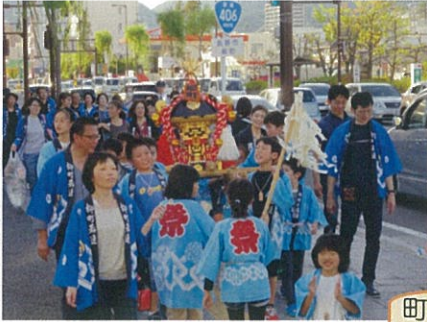
町を巡る子供神輿と 出番を待つ大人神輿