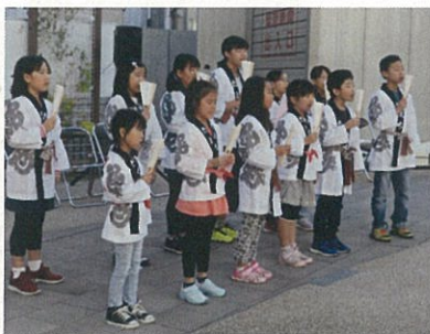
田町育成会 子ども木遣り