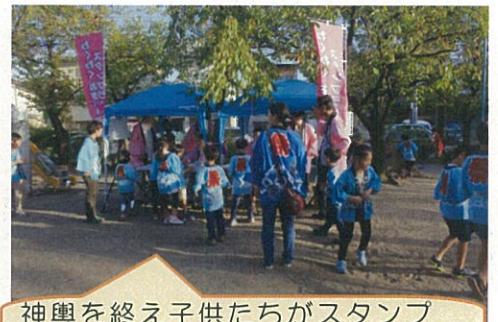
神輿を終え子供たちがスタンプ ステーションに集まって来ました