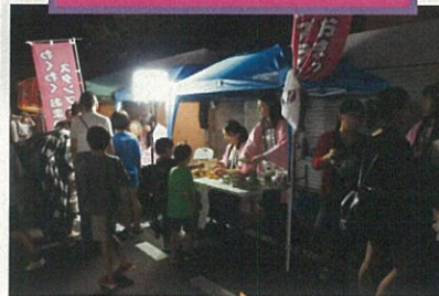
⑨ 9月23日 東鶴賀町 三神社