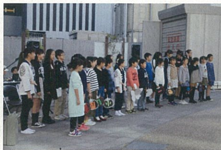
鍋屋田小学校合唱団