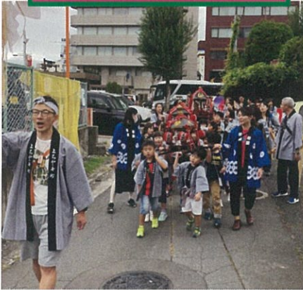
⑤ 9月15日 上千歳町・問御所町 藤の森神社