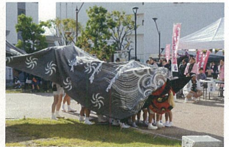
権堂町育成会 子ども獅子