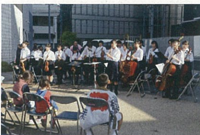
柳町中学校室内楽部