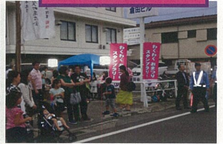
⑦ 9月16日 西鶴賀町 竹山稲荷神社