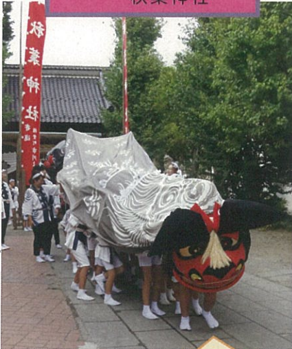
① 8月27日権堂町 秋葉神社

権堂の秋葉神社から子ども獅子が町内を元気に練り歩き祭り気分を盛り上げていました。