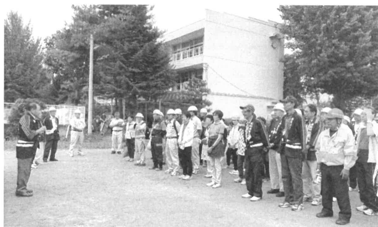
令和元年9月4日に開催した第三地区防災訓練の様子

新型コロナウイルスの影響により4月25日に予定していた総会を中止とし、協議会会則第8条第2項「役員会は、やむを得ない事情で評議委員会が開催できない場合、評議委員会の評議決定を代行することができる」に基づき、役員会で総会議案の評議決定を代行します。また権堂町で発生した新型コロナ感染の影響で、4月17日予定していた役員会も急遽書類決議に変更致しました。