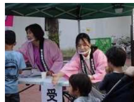
受付は間隔をあけて、マウスシールド着けて