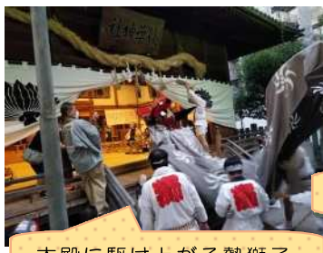
本殿に駆け上がる勢獅子