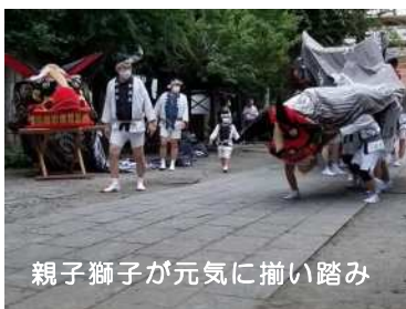
親子獅子が元気に揃い踏み