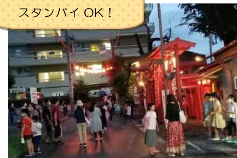
スタッフも法被姿で スタンバイOK!

神社参拝もソーシャルディスタンスで、参加賞も整然と並んで、新しい生活方式が身についたんですね!久しぶりに会ったご家族どうしが絶妙な距離を保ちつつ楽しそうに交流して微笑ましいひとときです。例年のとおり寿々園さんの美味しいアイスクリームが参加賞に提供され、参拝者にはお土産が渡されて大人も子ども達も嬉しそうに頂いていました。